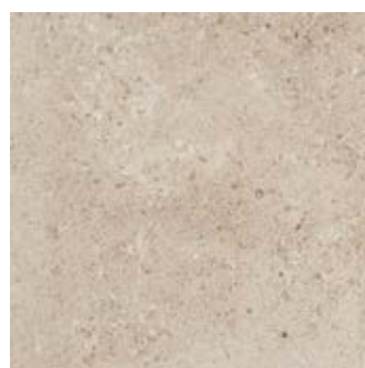
MHE1 Gris Fleury20 Beige20 60x60