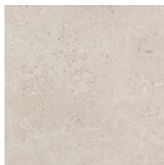
MLD5 Gris Fleury20 Bianco 60x60