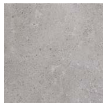
MM53 Gris Fleury20 Grigio 60x60