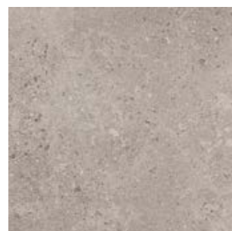
MLF2 Gris Fleury20 Taupe 60x60